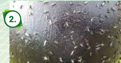
En svart fluefangerball med Sticky trap lim